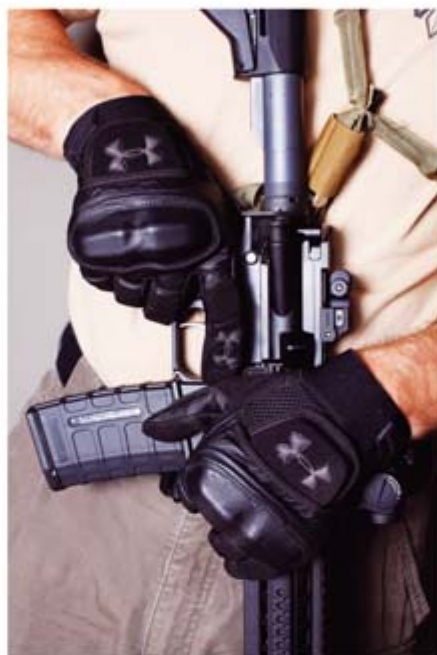
Under Armour Handschuhe "Blackout Tactical" und "Combat Glove" mit ausgeprägtem Faustknöchelschutz.