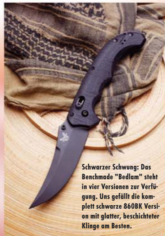
Schwarzer Schwung: Das Benchmade "Bedlam" steht in vier Versionen zur Verfügung. Uns gefällt die komplett schwarze 860BK Version mit glatter, beschichteter Klinge am Besten.