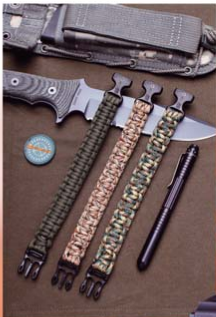
Bei Rivers & Rocks gibt es diese geflochtenen Survival-Armbänder aus Paracord.