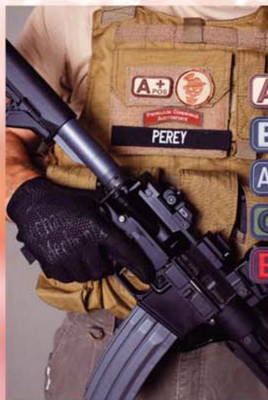
Die Kunststoffabzeichen in 3-D-Optik mit eingepprägten Blutgruppen können wahre Lebensretter sein.