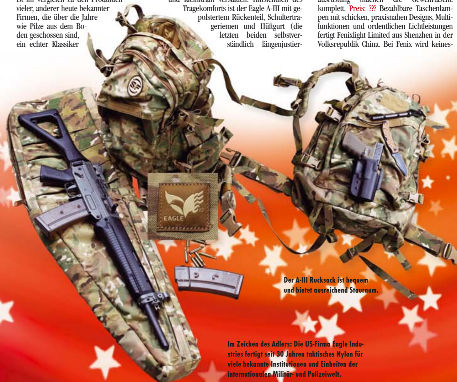
Der A-III Rucksack ist bequem und bietet ausreichend Stauraum.

Im Zeichen des Adlers: Die US-Firma Eagle Industries fertigt seit 30 Jahren taktisches Nylon für viele bekannte Institutionen und Einheiten der internationalen Militär- und Polizeiwelt.